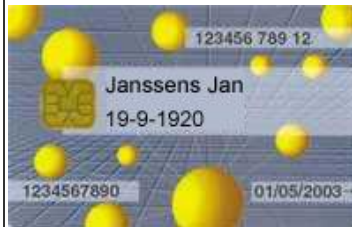
SIS-kaart van het kind