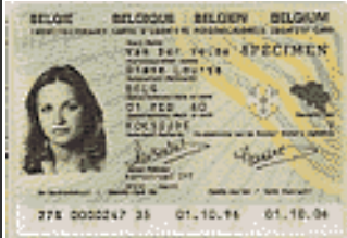
Identiteitskaart van het kind